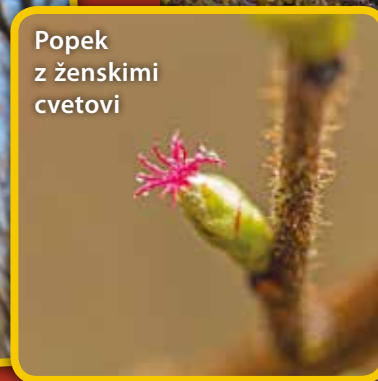
Popek z ženskimi cvetovi