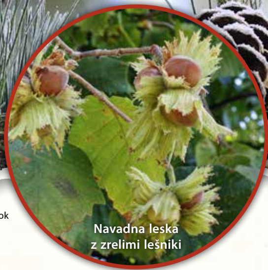
Navadna leska z zreliimi lešniki

Pripravil: RUDI OCEPEK ~ Fotografije: SHUTTERSTOCK, arhiv Arboretuma Volčji Potok