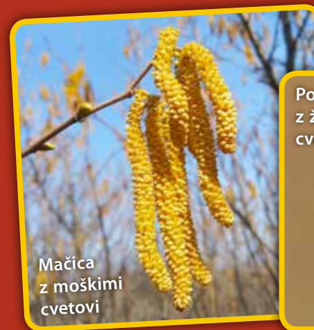
Mačica z moškimi cvetovi